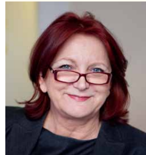
Liebe Mandantinnen, liebe Mandanten,

Auch in der letzten Entscheidung des BGH zum Unterhaltsrecht wies der BGH auf eine grundsätzliche Verpflichtung zur Ganztags-