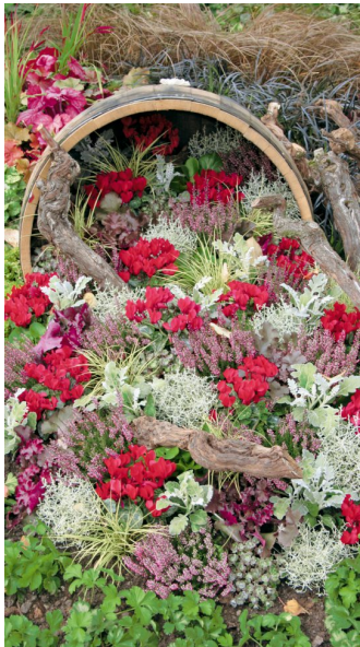
Ruhestätte für einen Winzer: Ein Weinfass ziert das Grab.